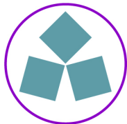
01_細輪に偶合わせ三つ石